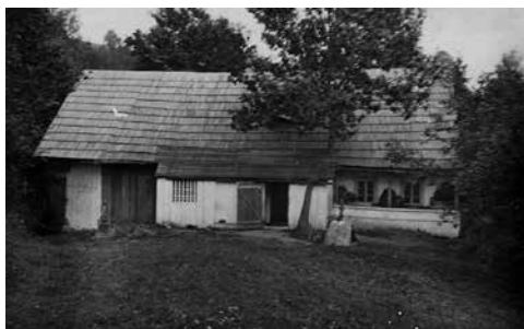
Pastviny č. p. 10 rodným dům Josefa Pazourka

Po vyhlášení mobilizace odjel na východní frontu, kde během bojů padl do zajetí. Jakmile vstoupil do