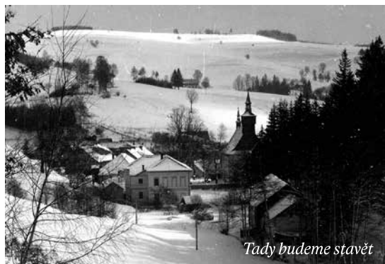
Tady budeme stavět