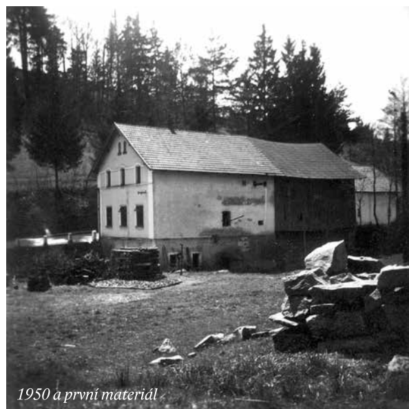
1950 a první materiál