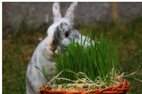
Lucka Kotizová (9. tř.)