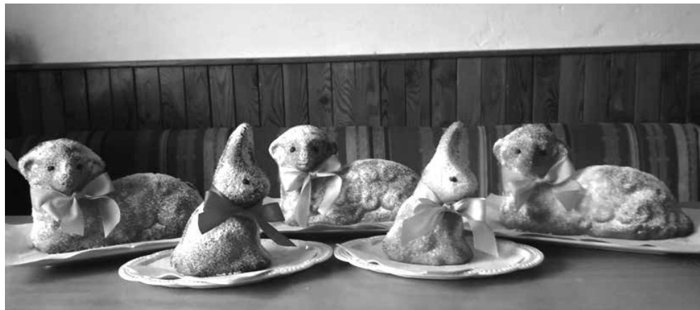
Terka Suchodolová (9. tř.)

z pěstitelských prací zněl jasně: zasít a vypěstovat osení, ozdobit a poslat foto. Všichni žáci, kteří tento úkol splnili, mají od paní učitelky pochvalu. Někteří se pustili i do „větší akce“ – například pečení mazance. Výsledkem je řada krásných fotek. Bylo by škoda nepodělit se alespoň o některé z nich. Tady jsou: