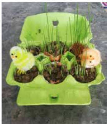
Kryštof Kalous (6. tř.)