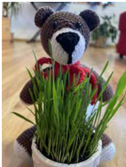
Verča Dolečková (9. tř.)