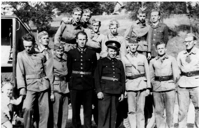
Část budovatelů hasičárny –