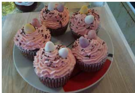
Verča Rousová (9. tř.)