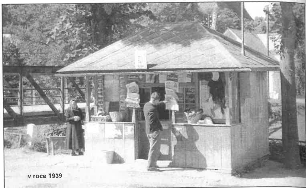
v roce 1939

kuličky. Za deset haléřů deset krásných barevných kuliček, jednu za haléř. U národníčky jsme patou vrtali důlky a pořádali turnaje, u Grýnů kupovali mejdlíčko a kostky šumáků, které rozdíraly jazyk. Později bylo na pultě i přepychové zboží – Eskymo za padasátník. Připouštím, že