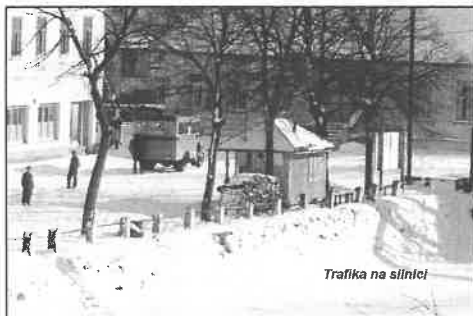
Trafika na slínici

a zaměstnal Aninku Pavlíčkovou, dceru cestáře Dolečka (Krupaře), která vařila a vydávala polévky. Podnikatelský záměr se vydařil a první investice směřovala opět do Klášteřce.