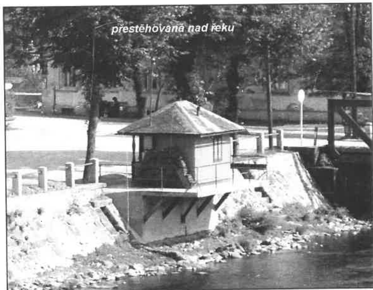
přestěhovaná nad řeku

Původní prodejníčka stála na silnici, což se rad-