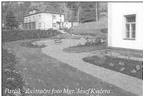
Parčík - ilustrační foto Mgr. Josef Kvičera

a to zejména vzhledem k tomu, že se plánuje její celková oprava. Po opravě musí být užívána tak, aby nebyla ničena např. nadměrně těžkými soupravami při odvozu dřeva. Dále p. místostarostka podala informace o pokračující rekonstrukci MŠ. 22.8.2008 proběhla kontrola ze SFŽP na stavbě a na obecním úřadě. Pracovnice SFŽP kontrolovala administrativní správnost žádosti a konzultovala další kroky obce ve vztahu k SFŽP.