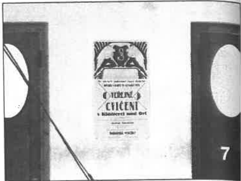
č. 5 - slavnost otevření - uprostřed na balkoně Sokolovny Ferdinand Kalous st.19