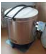
Občanské sdružení CEMA Žamberk Zkvalitnění hřiště a tvůrčí dílny