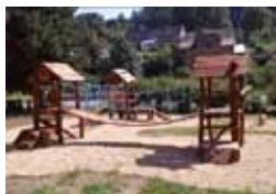
Obec Bystřec Dětská hřiště