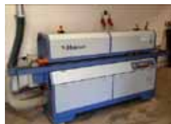
Zdeněk Krejsa Rozvoj provozovny truhlářské zakázkové výroby