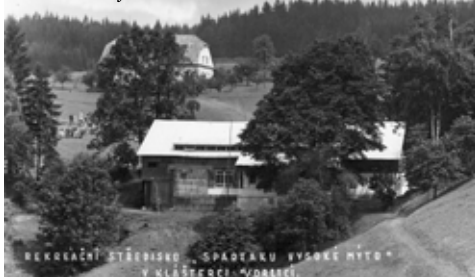
Dětský tábor s budovou původního Dolečkova mlýna na kostní moučku

hodně daleko. Odpojíme anténu, televize nepůjde a holky půjdou spát! Jednoduché, ale hrázkou nešlo pootočít a na tu zatracenou dvojlinku, která obloukem mířila k chalupě, jsme nemohli dosáhnout. Pomohla větev. Utrhnout jsme to nechtěli, stačí přelomit jeden drátek... S rukama nad hlavou jsme se dlouho marně snažili a v kapse ani mizerný klíček. Pak přišly na řadu zuby, uslintanou dvojlinku jsme si do nekonečna předávali. Ten jeden drátek jsme ničili tři čtvrtě hodiny!