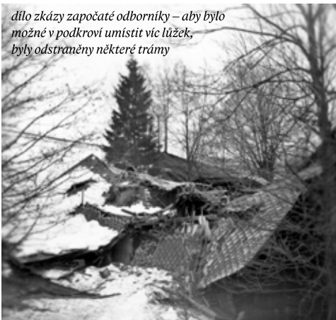
dílo zkázy započaté odborníky – aby bylo možné v podkrovi umístit víc lůžek, byly odstraněny některé trámy

Nedávno jsme na tuto příhodu s jednou kuchařinkou vzpomínali a moc jsme se u toho nasmáli.